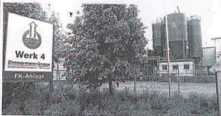
Darum dreht es sich: Die Mischer in Werk 4 sollen gut zwei Stunden am Tag länger in Betrieb sein. 30.000 Tonnen Material will Zimmermann pro Jahr zusätzlich bearbeiten.