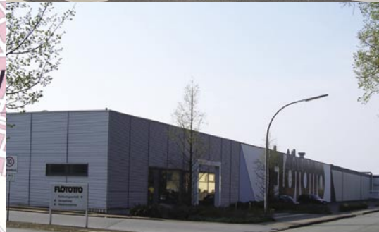
Forderung: Revitalisierung des Flötotto-Geländes