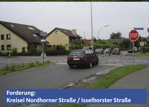
Forderung: Kreisell Nordhorner Straße / Isselhorster Straße