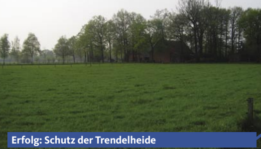
Erfolg: Schutz der Trendelheide