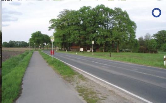
Forderung: Mehr und sicherere Bushaltestellen