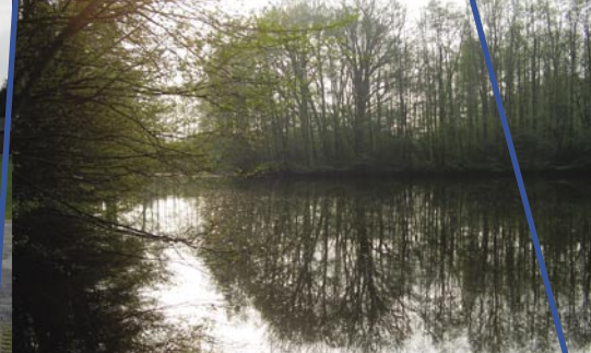
Forderung: Naherholungspark Avenwedder See