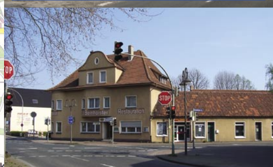
Forderung: Jugend- und Bürgerhaus Friedrichsdorf