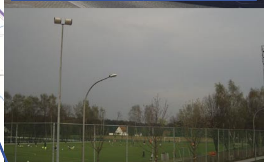
Erfolg: Kunstrasenplatz Friedrichsdorf