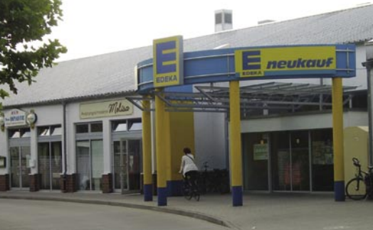
Forderung: Nahversorgungszentrum Avenwedde-Mitte