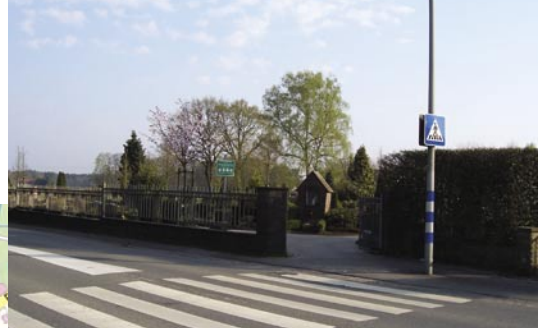
Erfolg: Querungshilfe am Friedhof Friedrichsdorf