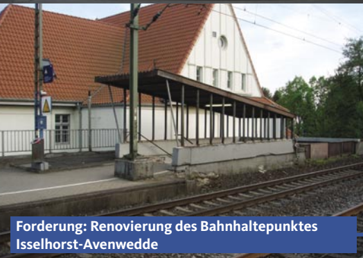
Forderung: Renovierung des Bahnhaltpunktes Isselhorst-Avenwedde