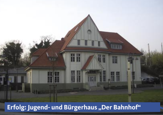
Erfolg: Jugend- und Bürgerhaus „Der Bahnhof“